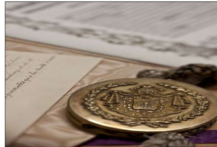
ANLux, Extraits du Traité de Londres, 1867.