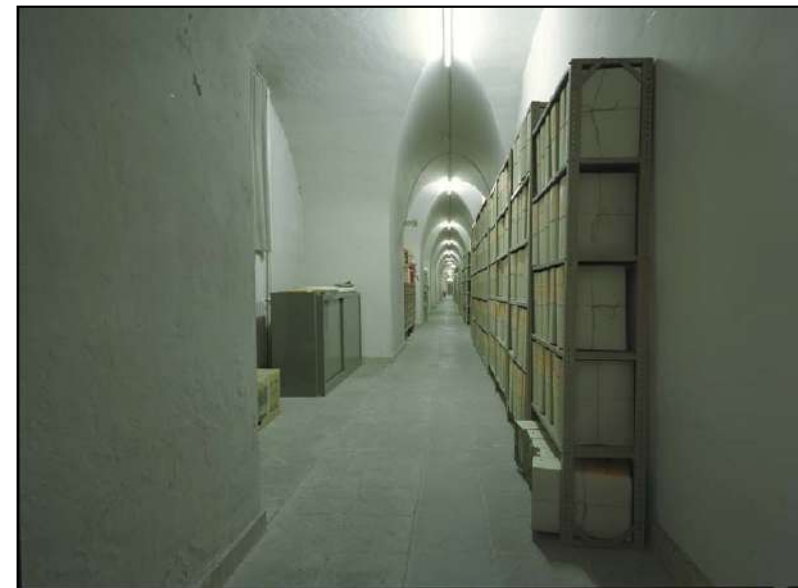
Le fonds des Affaires étrangères aux ANLux.