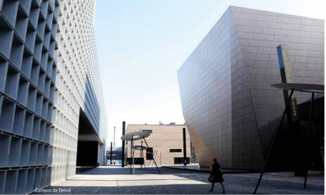
Campus de Belval