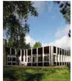
Campus de Kirchberg