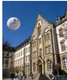
Campus de Limpertsberg

Le Campus de Kirchberg se trouve au cœur du quartier des affaires de la ville de Luxembourg, de la place bancaire et financière internationale et à proximité des institutions européennes. Les espaces commerciaux du Kirchberg, la Coque (salles multiports et piscine olympique), le Musée d'Art Moderne Grand-Duc Jean (Mudam) ainsi que la Philharmonie du Luxembourg se situent à quelques mètres du site universitaire. Certains cours de Masters en Droit sont donnés au bâtiment Weicker au Kirchberg.