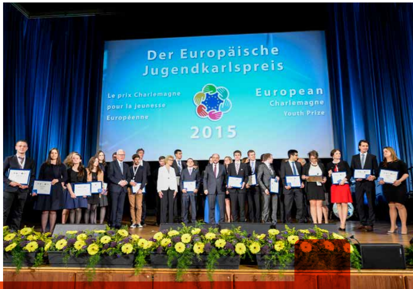
Youth Prize

“The students of the Master in European Contemporary History at the University of Luxembourg successfully bring history to life and illustrate it. [...] They manage to make us comprehend the history of the 20th century through the communications technology of the 21st century.” Martin Schulz at the 2015 Charlemagne Youth Prize ceremony